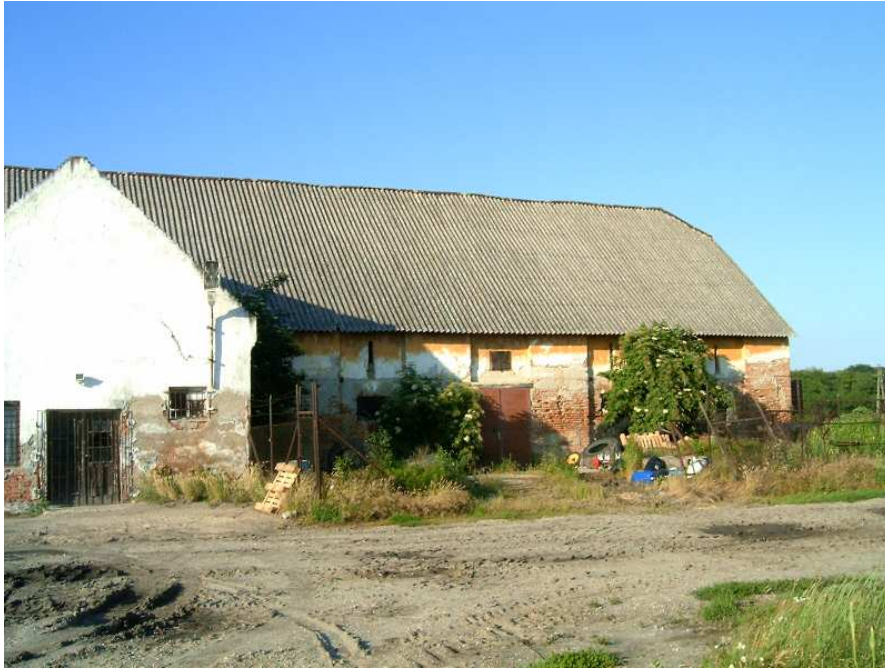
Az 5-6. épület a 3-kal azonos megítélés alá esik.

Az épület megtartása technikatörténeti szempontból is javasolható. Ezt erősíti az is, hogy állapota megfelelő, jól felújítható, hasznosítható. Azonban figyelembe kell venni azt is, hogy megtölthető-e funkcióval értelmesen a két „mag” épület szomszédságában, és azt is, hogy beilleszthető-e mai adottságaival a településfejlesztési koncepcióba. Meggyőződésem, hogy nem szabad figyelmen kívül hagyni e szempontokat sem. Ezért elfogadhatónak tartom az épület bontását is, azzal a feltétellel, hogy specialitásai miatt a bontást megelőzően részletes és alapos műemléki, műszaki felmérést kell készíteni az épületről, bontásánál pedig épületrégészeti vizsgálat és felügyelet biztosítandó. A tömeg meghatározó paraméterei, és a nyílásrendszer ritmikája, a homlokzat rendszere irányadóak lehetnek az új épület tervezése során.