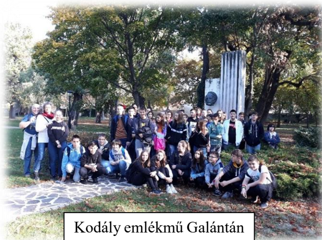
Kodály emlékmű Galántán

Kodály Zoltán 1892-1900 között élt Nagyszombaton. A nagyszombati érseki gimnáziumban tanult, a Szent Miklós bazilikába járt iskolatársaival misére. Kodály első zeneszerzői szárnypróbálgatásai a gimnáziumi éveire tehetőek. Ekkor születtek az Ave Maria szóló és a Stabat Mater c. művei . Felkerestük a kétnyelvű Kodály emléktáblát, meglátogattuk a bazilikát.