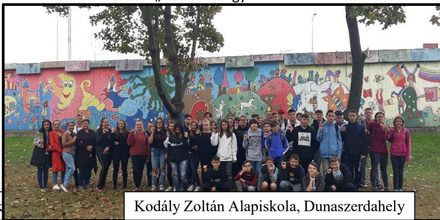
Kodály Zoltán Alapiskola, Dunaszerdahely