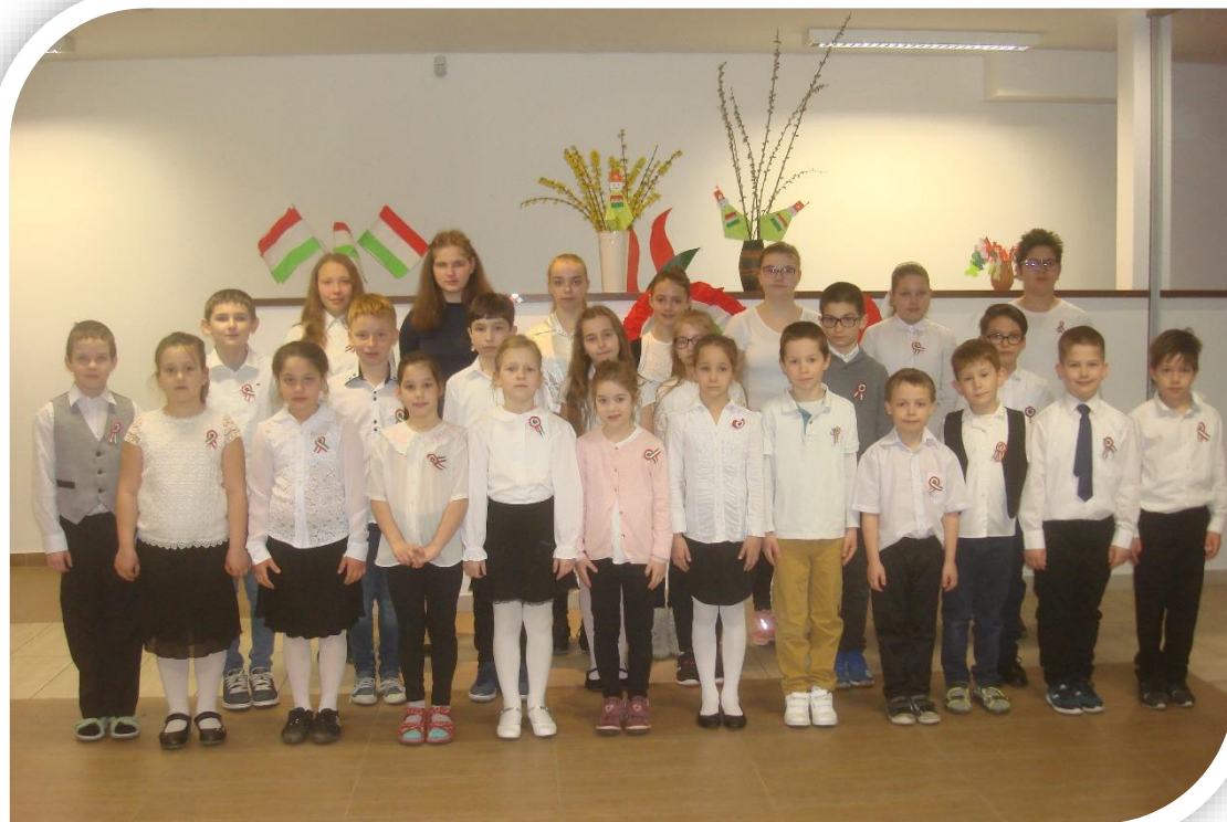
A képen az énekkar tagjai láthatóak.